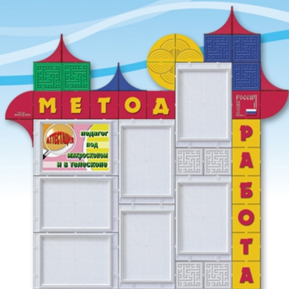
Методработа Код 21136 Цена 5850 руб. 1,3 x 1,3 м