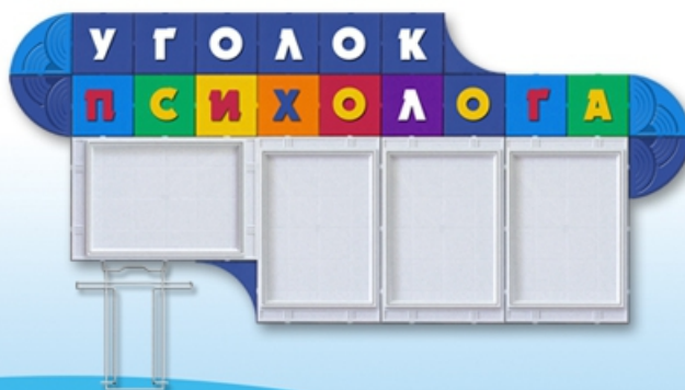
Уголок психолога Код 21106 Цена 3770 руб. 1,4 x 0,6 м