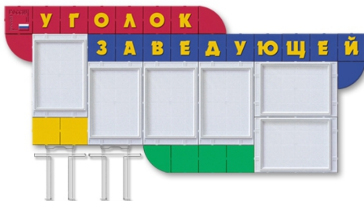
Уголок заведующей Код 21105 Цена 5070 руб. 1,6 x 0,8 м