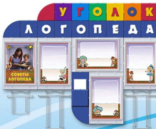
Уголок логопеда Код 21096 Цена 4160 руб. 1,2 x 0,9 м